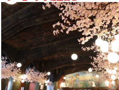
お花見ビヤホール

ビヤホールライオン 銀座七丁目店にて4月17日（日）までの期間限定で店内を大々的に桜の装飾をした「 お花見ビヤホール 」を実施中です。創建 88 周年を迎える現存する日本最古のビヤホールで、日本らしいお花見が楽しめる期間限定のイベントです。