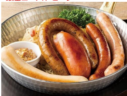
ソーセージ 5 種盛合せ

また、4月7日までは、 サッポロ生ビール黒ラベル特大ジョッキ を謝恩価格 888 円（税込 976 円） 、創建日後の4月9日（土）・10日（日）では、 ソーセージ 5 種盛合せ を謝恩価格 1,888 円（税込 2,076 円） にて提供します。