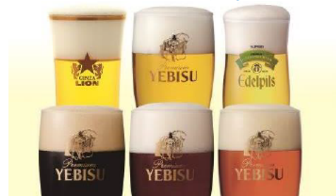
6種の生ビールが飲み放題