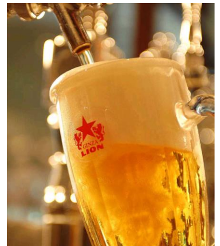
サッポロ生ビール黒ラベル(大ジョッキ)イメージ