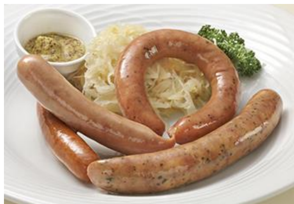
特別メニュー ソーセージ盛合せ イメージ

※今回販売する「ソーセージ盛合せ」はイベントに合わせ全フロアで販売するためにご用意した特別メニューです。