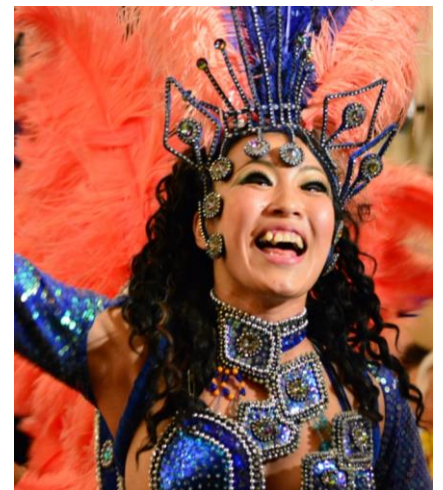
ライオン サンバ・カーニバル イメージ