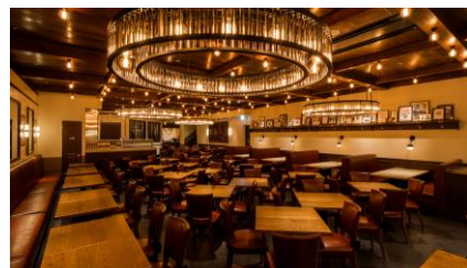
銀座ライオン GINZA PLACE 店 (B2)