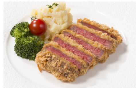
新橋店限定、プライムビーフの「ビーフカツ」

新橋駅前であざやかだった新橋店の流れを汲みつつも、新しい魅力も兼ね揃えた、一日中気兼ねなく生ビールを楽しめるビヤホールです。