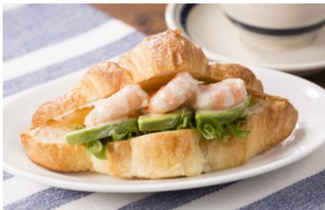
海老とアボカドのクロワッサンサンド

ドリンクは、「有機栽培ブレンドコーヒー」「黒糖ミルクコーヒー」をはじめ各種ソフトドリンク、また「サッポロ生ビール黒ラベル」やクラフトビール「Craft Lable」3種、強炭酸ハイボールなど各種アルコールをご用意し、終日ご提供します。フードは、モーニングタイム(7:30~10:00)には「ホットドック」や「海老とアボカドのクロワッサンサンド」などの軽食を、ランチタイム(10:00~15:00)には「チキンカレー」や「焼きキーマカレー」など4種類のカレーをご用意します。パブタイム(15:00~23:30)には「生ハム盛合せ」や「フィッシュ&チップス」といったおつまみ料理をご用意します。