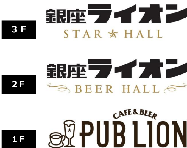
「銀座ライオン 新橋店」各フロア呼称

「銀座ライオン 新橋店」は、昭和32年（1957年）の開店より60年近くに渡り営業をし続け、新橋の地に根差したビヤホールとして、近隣のオフィスワーカーをはじめ多くのお客様から愛されているお店です。入居ビル建替えに伴い平成26年（2014年）5月末より長期休業していましたが、本年7月15日（金）に装いも新たにリニューアルオープンします。