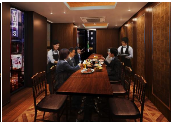
3階 銀座ライオン STAR HALL (パース)