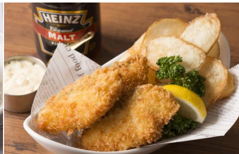
フィッシュ&チップス