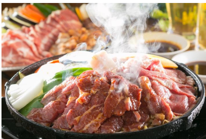
バーベキューコースイメージ

昭和6年開業の「浩養園」は、今年6月で85年を迎えます。この浩養園の敷地内で開催するビヤガーデンは、爽快な風を生み出す滝が流れ、木立が並び、涼しげな雰囲気味わえる「名古屋の夏の風物詩」として、例年近隣のオフィスワーカーからご家族連れまで幅広いお客様からご利用いただき、好評いただいています。