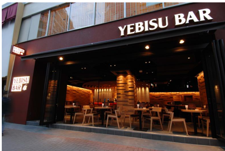
「エビス with ジョエル・ロブション 華やぎの時間<樽生>」は、YEBISU BAR 全店で販売します。画像は「YEBISU BAR 銀座コリドー街店」。

「エビス with ジョエル・ロブション 華やぎの時間」とは、サッポロビール株式会社が1月26日（火）に発売する「エビス with ジョエル・ロブション」シリーズの缶商品です。この発売に先立ち、YEBISU BAR では一週間早く<樽生>として数量限定で販売します。ひと足早く「華やぎの時間」をお楽しみください。