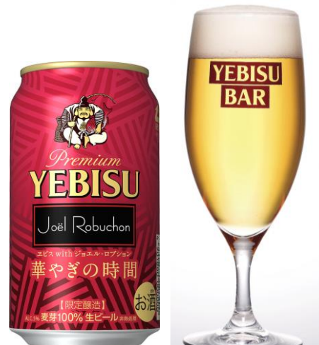
左：エビス with ジョエル・ロブション（350ml 缶） 右：<樽生> 提供イメージ

※グラスの色合いは実物と異なる場合があります。 ※缶とグラスの縮尺は実物とは異なります。