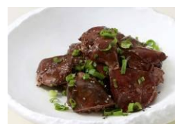
▲鶏レバーのスマーク (680円/終日販売)