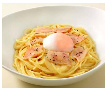
▲カルボナーラスパゲティ(950円/終日販売)