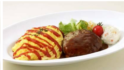
▲オムライスプレート (1,300円/10:00～24:00 販売)