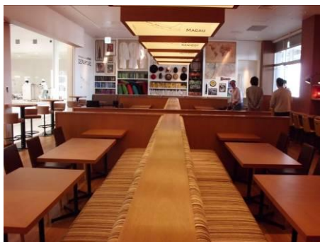
▲オープンで明るい店内

フライト前に少し立ち寄る方はもちろん、余裕を持ってお越しいただいた方も、それぞれ思い思いの時間を有効に消費していただけるお店を目指します。