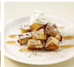
▲ひとくちフレンチトースト (480円/終日販売)