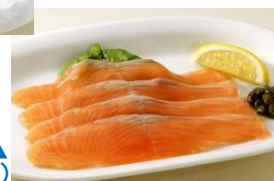
▲キングサーモンのスマーク (880円/終日販売)