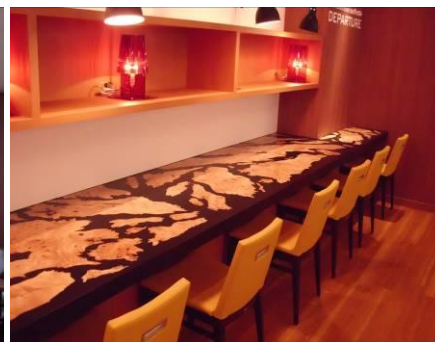
▲豪華なテーブルトップのカウンター席