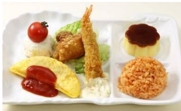
▲お子様ランチ (680円/10:00～24:00 販売)