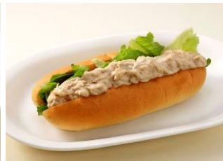
▲ツナホットドック (480円/10:00～24:00 販売)