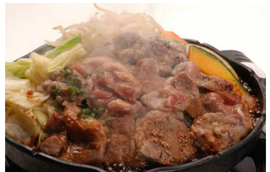
▲手もみ3種ジンギスカン

これまで長きにわたり当店をご愛顧いただいた多くのお客様に感謝の気持ちを込めて、9月10日（月）より、当店の人気メニュー「手もみジンギスカン食べ放題・飲み放題」を、感謝キャンペーンとしてディスカウント販売いたします。