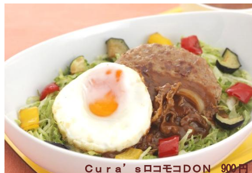
Cura's ロコモコDON 900円