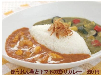
ほうれん草とトマトの彩りカレー 880円