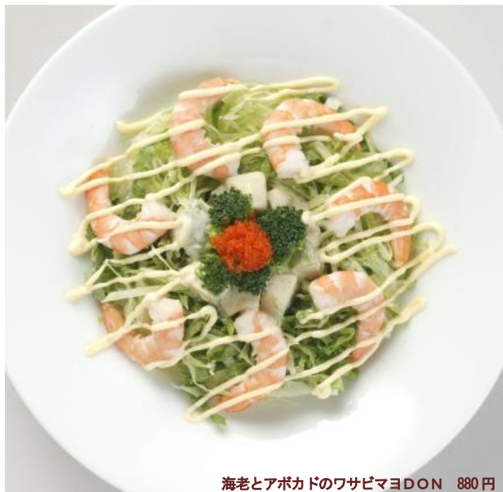
海老とアボカドのワサビマヨDON 880円