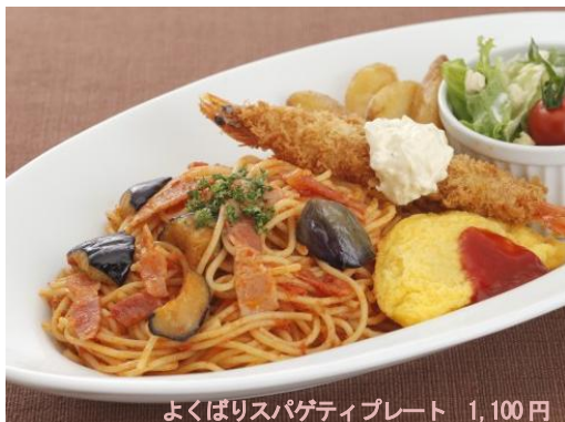
よくばりスパゲティプレート 1,100円