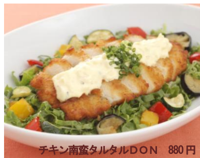
チキン南蛮タルタルDON 880円