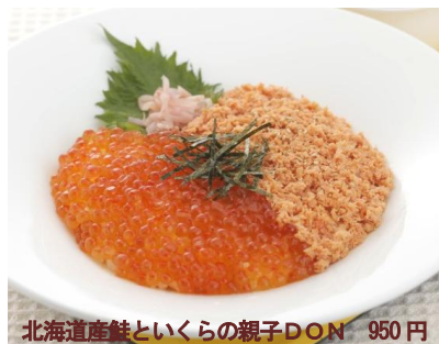
北海道産鮭といくらの親子DON 950円