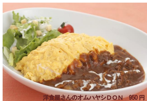
洋食屋さんのオムハヤシDON 950円