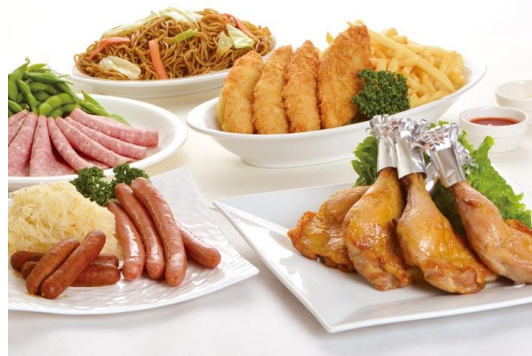
シルバーコース料理イメージ