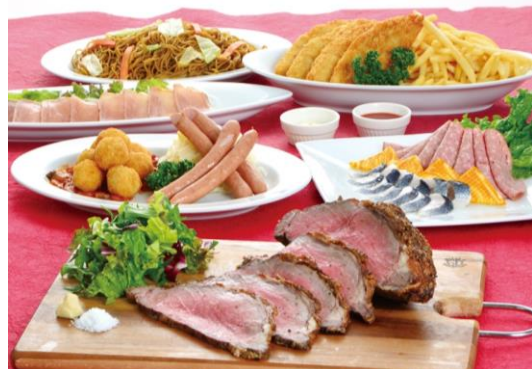
ゴールドコース料理イメージ