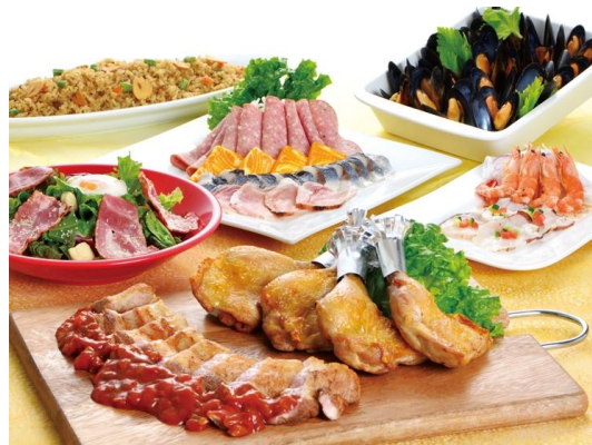
プラチナコース料理イメージ