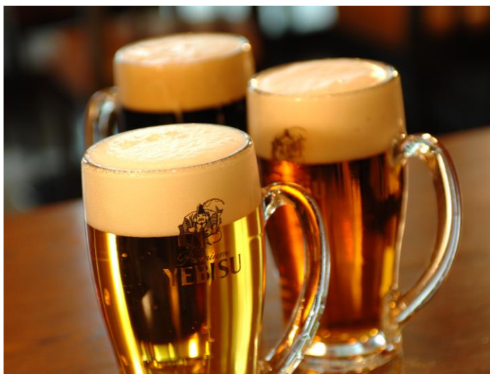
エビス飲み放題は3種のエビスを楽しむ

YEBISU BAR The GARDEN は、「ALL FOR YEBISU～エビスの魅力と世界観を楽しむ～」ことをコンセプトとしたビヤバー「YEBISU BAR 霞が関コモンゲート店」に隣接するスペースを利用して、期間限定で営業する120席を有するテラスタイプのビヤガーデンです。